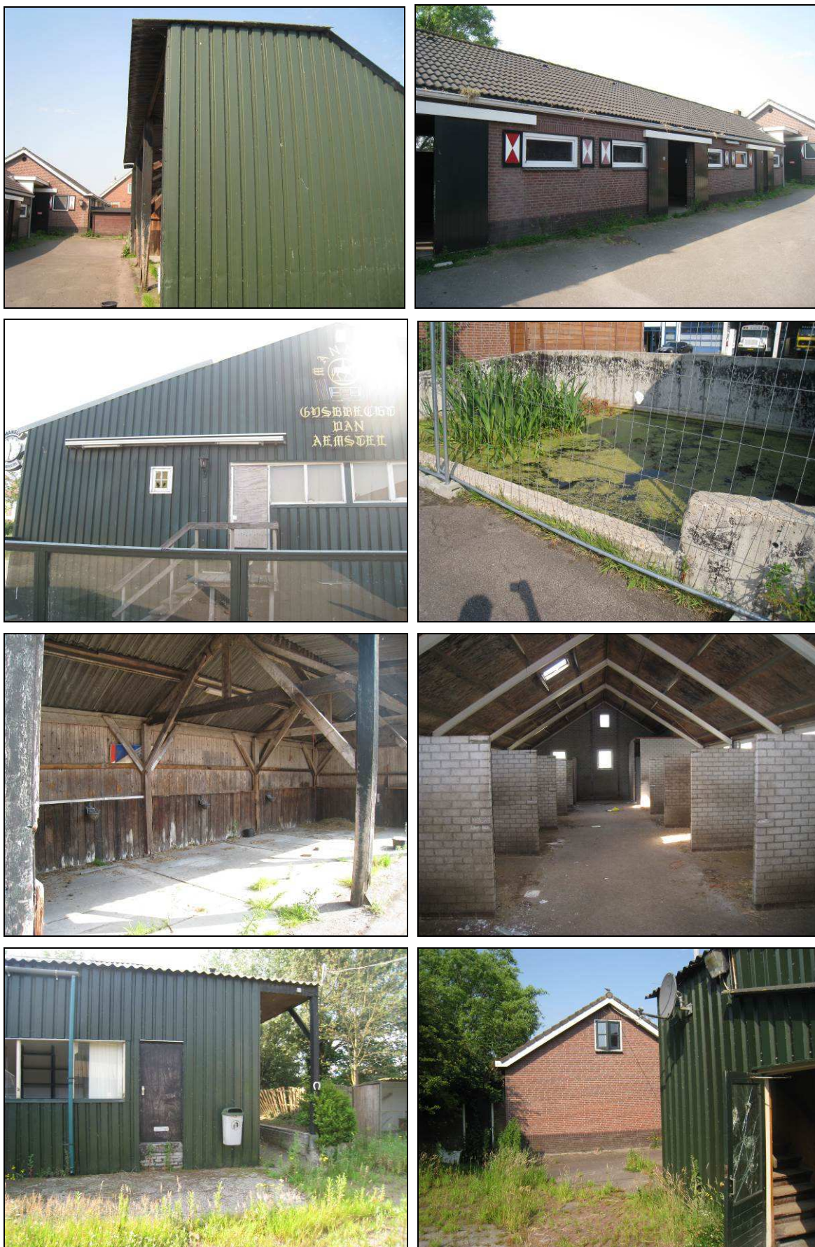
Figuur 2. Aanzicht van het gebied aan de Middenweg te Ouderkerk aan de Amstel.