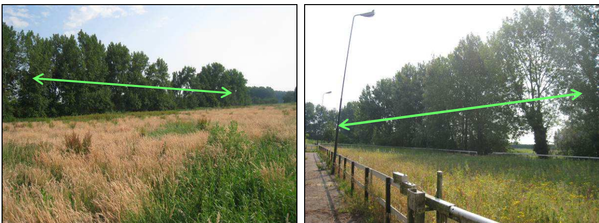
Figuur 3. Aanzicht van de houtwal in het gebied aan de Middenweg te Ouderkerk aan de Amstel die vleermuizen kunnen gebruiken als vliegroute.

De houtwal die door het gebied loopt is een historische landschapselement (zie figuur 3). Op lijnvormige landschapselementen kunnen vleermuizen zich oriënteren. De houtwal kan een essentieel onderdeel vormen in een vliegroute van vleermuizen tussen de wateren Waver en de Ouderkerkerplas (zie figuur 4). Het plan beïnvloedt deze landschapselementen negatief als gevolg van lichtverstrooiing en doorgangen. Effecten op vliegroutes kunnen derhalve niet worden uitgesloten.