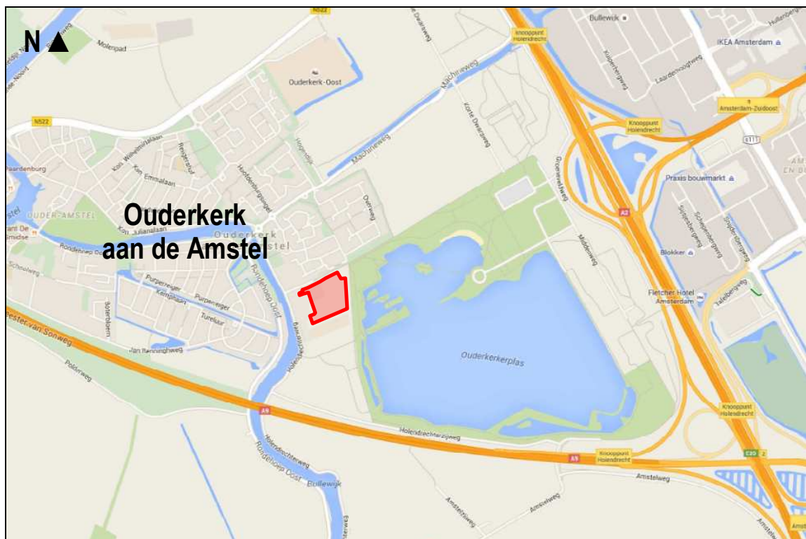
Figuur 1. Globale ligging van het plangebied aan de Middenweg te Ouderkerk aan de Amstel.

Er is het voornemen voor de realisatie van woonbebouwing aan de Middenweg te Ouderkerk aan de Amstel. Het voorkomen van beschermde soorten vormt een te onderzoeken aspect omdat met de plannen effecten kunnen gaan ontstaan op planten- en diersoorten die beschermd zijn via de Flora- en faunawet. Op grond hiervan heeft Rho adviseurs voor leefruimte te Rotterdam aan Adviesbureau Mertens B.V. uit Wageningen gevraagd om een verkennend veldonderzoek uit te voeren naar het voorkomen van wettelijk beschermde soorten en om bij het eventueel voorkomen hiervan, aan te geven hoe hiermee dient te worden omgegaan. In dit rapport worden de resultaten van deze verkenning gepresenteerd.