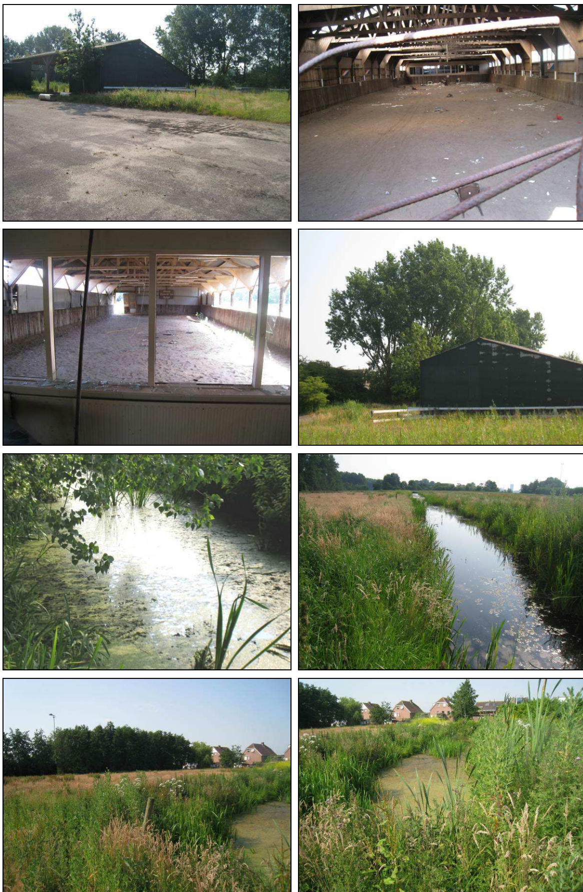
Vervolg figuur 2. Aanzicht van het gebied aan de Middenweg te Ouderkerk aan de Amstel.