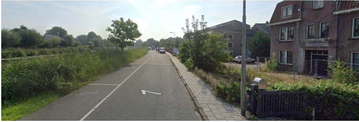
Afbeelding 10: Het Gezellenhuis aan de Bullewijk