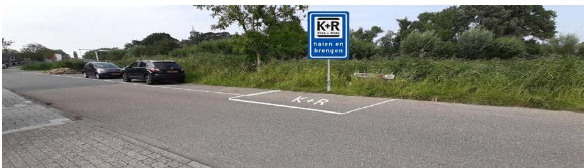
Afbeelding 9: Kiss&Ride ter hoogte van Rondehoep 29

Voor het pand is een Kiss&Ride-vak ingericht om bezoekers af te zetten, de chauffeur kan vervolgens doorrijden naar de Ambachtenstraat. Op de website staat aangegeven dat aanrijden met de auto het makkelijkste is via de Machineweg om vervolgens bij de Benninghbrug rechtsaf te slaan, om zo verkeer via de Kerkstraat tegen te gaan en de auto's meteen met de neus de goede richting in staan om zo kerende auto's zoveel mogelijk te voorkomen (zie afbeelding 8: aanrijroute via de Benninghbrug op Google Maps).