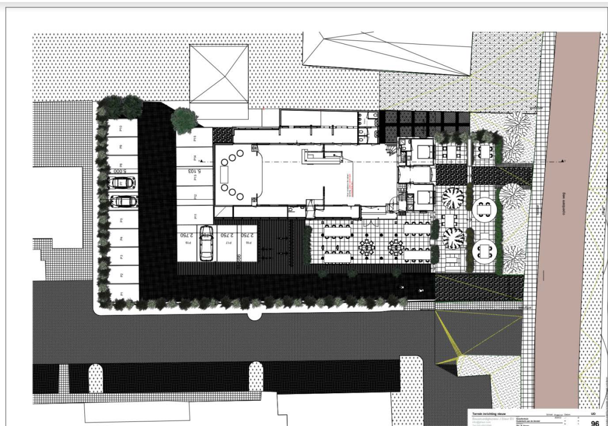
Afbeelding 5: Parkeergelegenheid op eigen terrein

Uit de 'Parkeerstudie Tuindorp Oud Zuid' van 2020 blijkt dat de parkeerdruk voor het gebied rondom het Gezellenhuis momenteel in balans is, wat betekent dat parkeren op eigen terrein moet worden gefaciliteerd. Team Gezellenhuis heeft adviesbureau RHO ingeschakeld voor aanbevelingen rondom verkeer en parkeren. Volgens de CROW- normen die gemeente Ouder-Amstel hanteert, is berekend dat er met 19 parkeerplekken ruimschoots wordt voldaan aan de criteria.