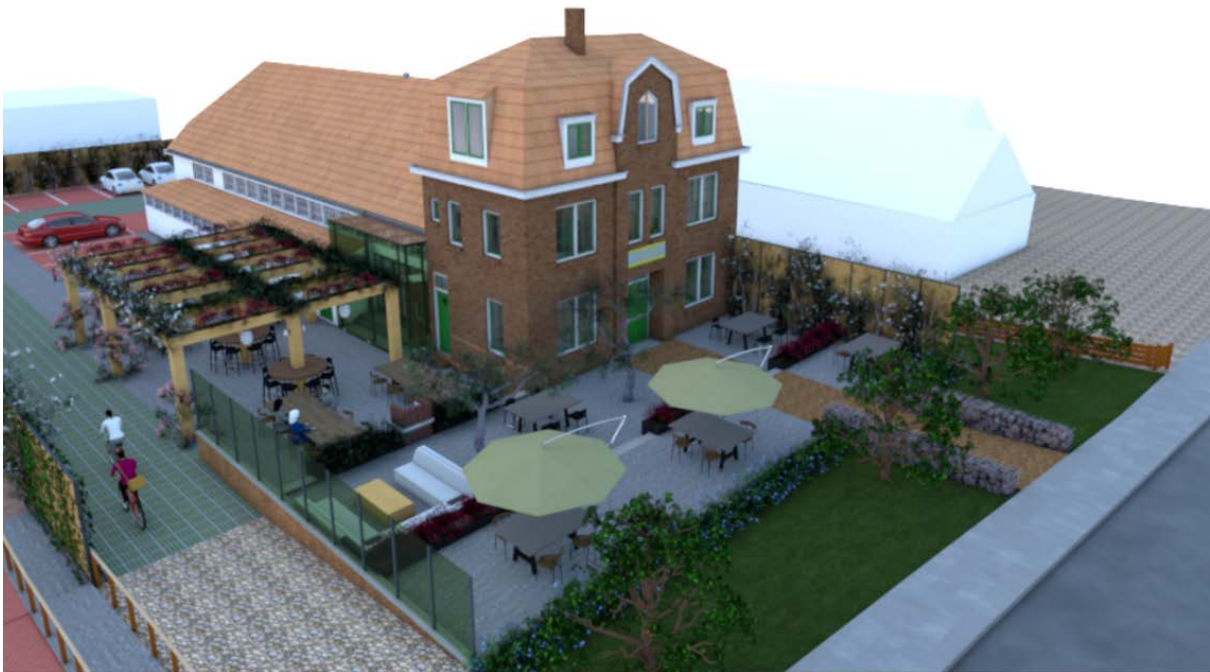
Afbeelding 1; 3D voorstelling van nieuwe situatie – oprijlaan, terras met geluidswanden

Na ruim vijftien jaar leegstand wordt het Gezellenhuis nieuw leven ingeblazen. In het nieuwe en multifunctionele concept van brouwen, babbelen, bikken, B&B en beleven in de vorm van een cultuurpodium zal de situatie rondom mobiliteit rondom het Gezellenhuis veranderen ten opzichte van de afgelopen jaren. Hoewel dit concept zich richt op fietsers en wandelaars in Amstelland kunnen we, met name door de komst van de zes slaapkamers, ook gasten met de auto verwachten. In dit plan zetten we alle verkeersstromen op een rijtje en komen we met gepaste oplossingen om het dorp en de buurt hier zo min mogelijk hinder van te laten ondervinden. De belangrijkste thema's zijn parkeren, aanrijroutes, geluid door verkeer en de maatregelen die hiervoor worden getroffen.