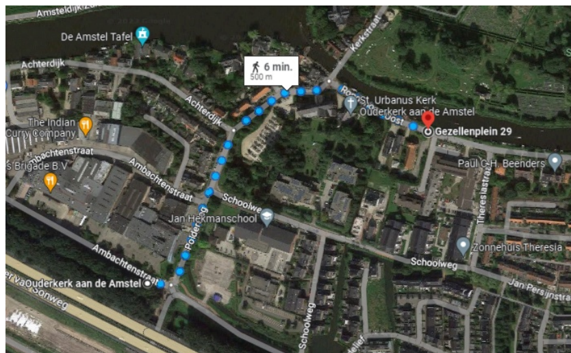
Afbeelding 7: Wandelroute van Ambachtenstraat naar Gezellenhuis

Dit parkeerterrein bevindt zich op slechts 500 meter afstand / enkele minuten lopen van het Gezellenhuis. Voor vrijetijds-functies geeft CROW een acceptabele loopafstand tot 600 meter aan. Hieraan wordt dus ruimschoots voldaan.