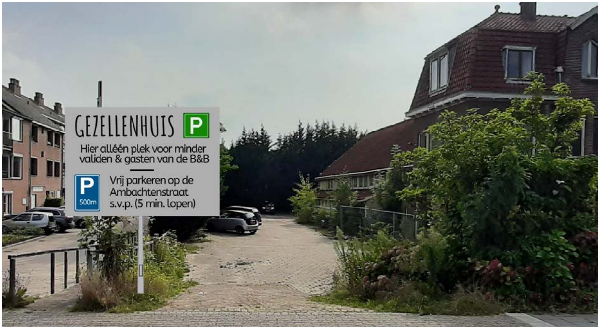
Afbeelding 6: Voorbeeld mogelijk parkeerbord (geen ware grootte)