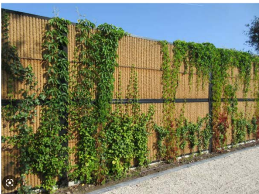
Afbeelding 11: Kokoswand met begroeiing

De wand is 2,5 meter hoog en gemaakt van speciaal geluiddempend kokosmateriaal met een natuurlijke uitstraling, waar gemakkelijk klimplanten tegenaan groeien. Door een extern onderzoeksbureau (M+P) is de invloed van het geluid op de omgeving gemeten. Deze wand is hierop ingericht. Door het plaatsen van de kokoswand en de hoogte van 2,5 meter zal de nieuwe situatie veel meer geluid dempen en tegelijkertijd veel ruimtelijker over komen dan de oude situatie met een coniferen haag als afscheiding. In samenspraak met de bewonersvereniging van Theresiastaete zal een keuze worden gemaakt voor het type klimplanten die de kokoswand aan de zijde van de bewoners zal begroeien. Ook rechts van het stenen voorhuis zal er een kokosafscheiding komen.