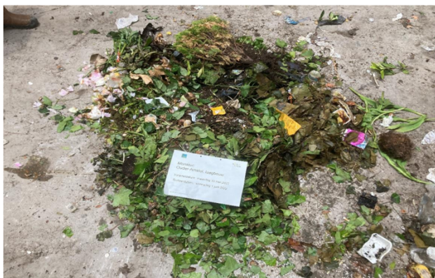
Tuinafval aangetroffen in fijn restafval Ouder-Amstel laagbouw