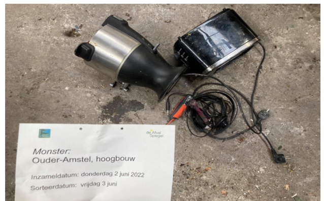
Elektrische apparaten aangetroffen in fijn restafval Ouder-Amstel hoogbouw