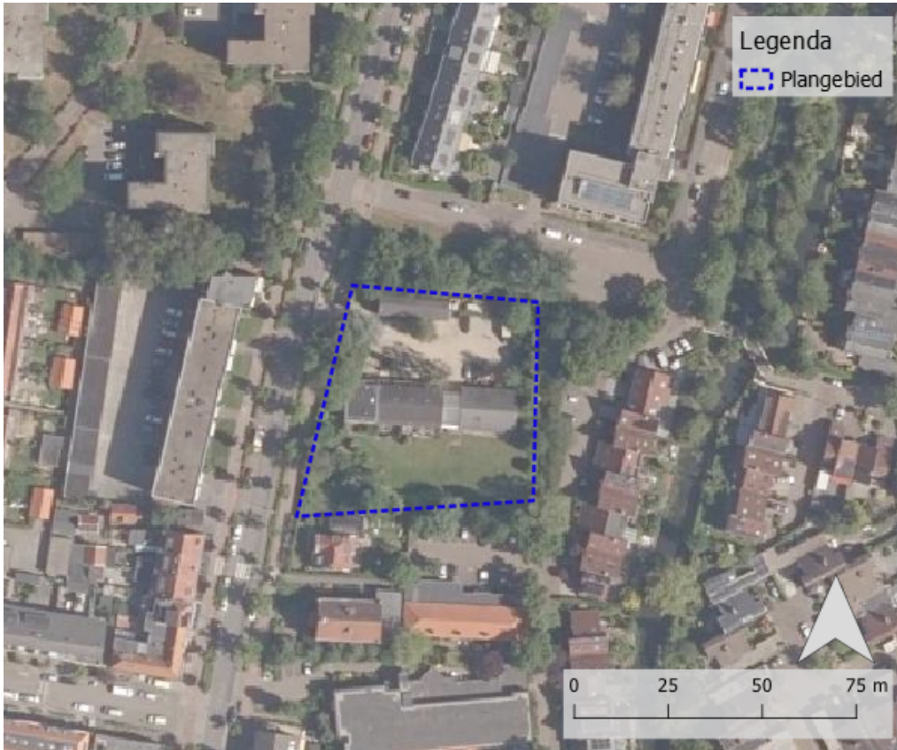
f2.1 Ligging plangebied

Het voornemen bestaat om op deze locatie woningbouw te realiseren. De bestaande bebouwing zal gesloopt worden, waarna hier woningbouw gerealiseerd zal worden. Sprake zal zijn verschillende typen woningen, te weten appartementen en grondgebonden woningen. In totaal wordt voorzien in 23 appartementen en 13 grondgebonden woningen.