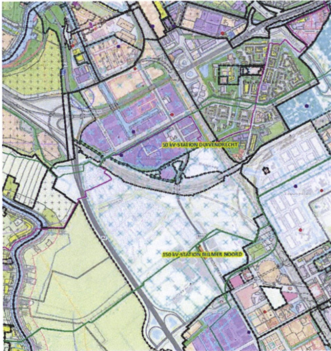
Afbeelding 1: Uitsnede ontwerpbestemmingsplan (noord) en 150kV kabels (groene lijnen)