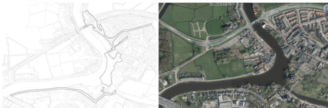
Figuur 3.2 Het haventje

Sinds 2016 is een bedrijveninvesteringszone (BI-zone) opgericht in het centrum Ouderkerk aan de Amstel. Ondernemers hebben zich verenigd om activiteiten in de openbare ruimte te ontplooiën. Naast het treffen van fysieke maatregelen zoals aankleding van het gebied met bloembakken, kan onder die activiteiten het organiseren van evenementen worden verstaan. Hierin wordt gefaciliteerd door de gehele BI-zone aan te wijzen als locatie voor het houden van evenementen. Deze evenementen zullen hoofdzakelijk gericht zijn op het winkelend publiek en de inwoners van de kern. Omdat de (verkeers)impact van dergelijke evenementen relatief hoog is en omdat 't Kampje wordt aangewezen voor het houden van (relatief) grote evenementen is het aantal evenementen, waarvoor de gehele BI-zone wordt gebruikt, beperkt tot drie per jaar. Evenementen van geluidscategorie I zijn niet toegestaan. Het maximaal aantal bezoekers voor evenementen in de BI-zone bedraagt 7.000. Omdat de terreinen Centrum Ouderkerk overig en Sluisplein zich niet in de nabijheid van elkaar bevinden, zijn op de verbeelding en in de regels twee verschillende zones aangehouden.