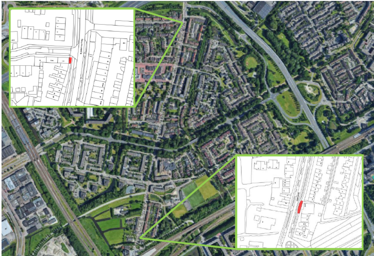
Figuur 3.12 Terrassen Duivendrecht