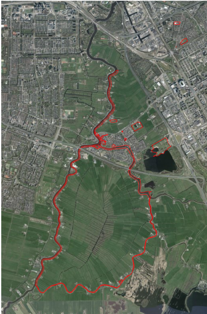
Figuur 1.1 Ligging evenemententerreinen

In tabel 1.2 zijn alle terrassen in de gemeente Ouder-Amstel opgenomen. Een groot deel van deze terrassen worden middels voorliggend bestemmingsplan mogelijk gemaakt. Andere terrassen waren reeds planologisch geborgd. In paragraaf 3.3 zijn de locaties van de terrassen weergegeven.