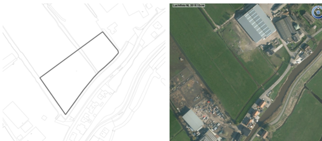
Figuur 3.7 Waver

circussen. De maximale geluidbelasting voor evenementen bedraagt 75 dB(A). Bij evenementen met geluidscategorie 1 is een geluidsbelasting hoger dan 100 dB(A) toegestaan. Op zondag t/m donderdag duren de evenementen maximaal tot 23:00 uur, op vrijdag en zaterdag tot 01:30 uur (daaropvolgende dag). Het maximaal aantal bezoekers is 720. Voor het Waverfeest geldt een eindtijd op donderdag van 1:30 uur.