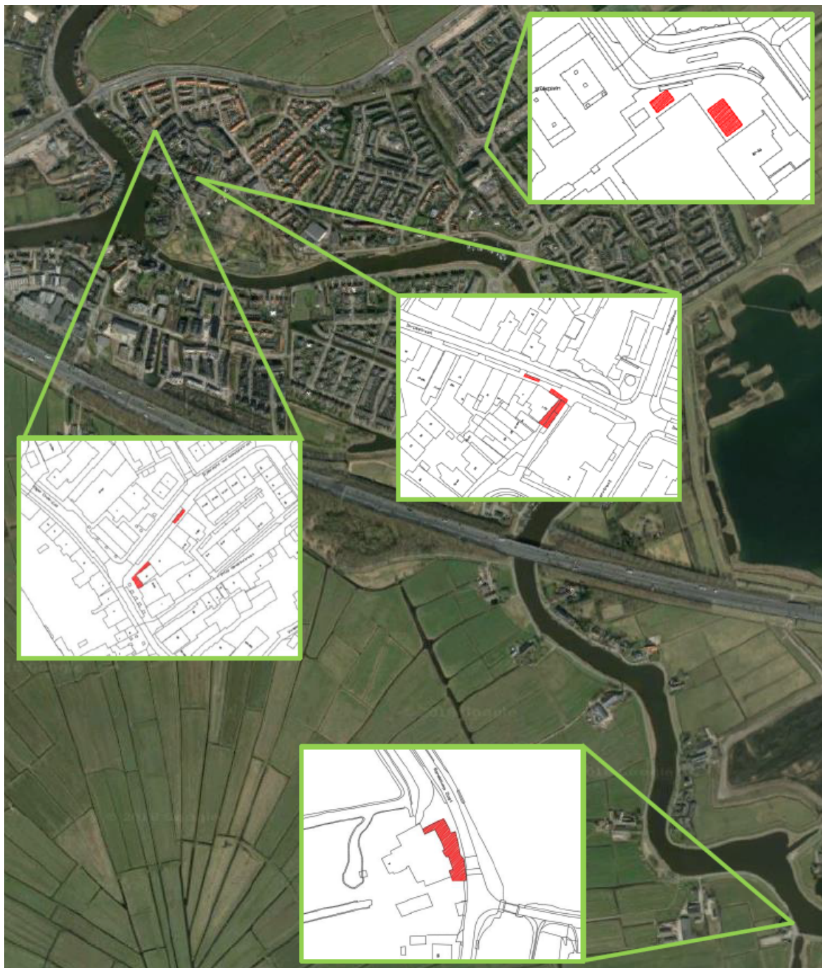
Figuur 3.11 Terrassen Ouderkerk aan de Amstel