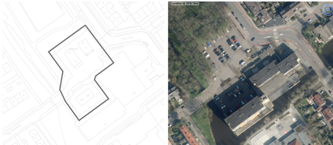
Figuur 3.3 Sluisplein