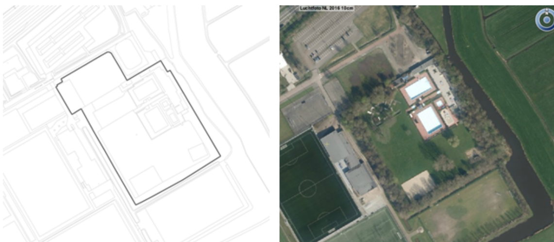
Figuur 3.6 Zwembad Amstelbad

Sport- en spelactiviteiten zijn reeds toegestaan. In aanvulling op het reguliere gebruik worden maximaal acht evenementen per jaar toegestaan, waarvan twee evenementen van geluidscategorie I. Dance evenementen zijn hier toegestaan. Niet geschikt voor het houden van evenementen met monstertrucks, kermissen en circussen. Voor wat betreft geluid is men gebonden aan de eisen uit het Activiteitenbesluit en de regels omtrent incidentele festiviteiten uit de APV. De maximale eindtijd voor geluid bedraagt op alle dagen 23:00 uur.