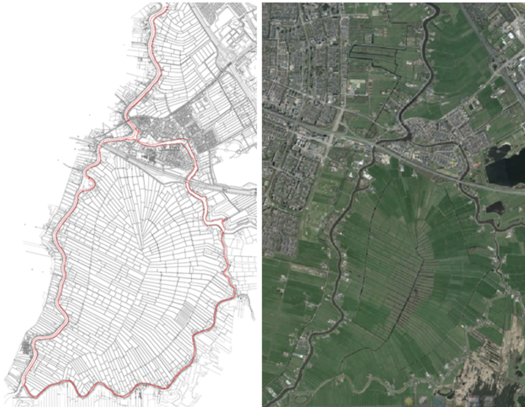
Figuur 3.4 Amstel en Bullewijk