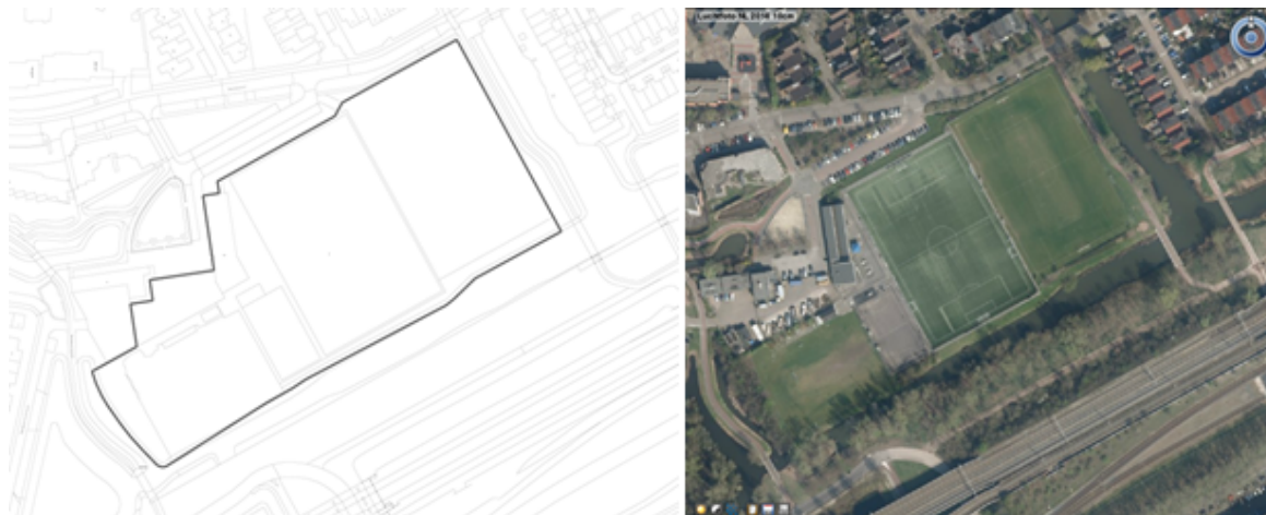
Figuur 3.10 Sportvelden Duivendrecht