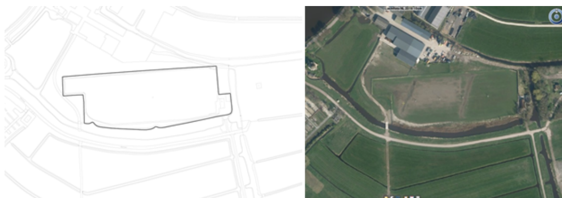
Figuur 3.8 Ijsbaan

Wanneer het vriest wordt aan het Molenpad een ijsbaan aangelegd. Gedurende de gebruikperiode van de ijsbaan, kunnen er evenementen worden gehouden op en aan de ijsbaan, met een maximum van zes per jaar en waarvan één van geluidscategorie I. Buiten die perioden is het gebruik van deze locatie voor het houden van evenementen niet toegestaan. Het terrein is niet geschikt voor het houden van evenementen met monstertrucks, kermissen en circussen. De maximale geluidbelasting voor evenementen bedraagt 75 dB(A); bij evenementen met geluidscategorie 1 is een geluidsbelasting hoger dan 100 dB(A) toegestaan. Geluid wordt gemeten voor de gevels van de dichtstbijzijnde geluidsgevoelige bestemming. Een evenement van geluidscategorie 1 duurt maximaal 1 dag. De maximale eindtijd van evenementen bedraagt op alle dagen 23:00 uur.