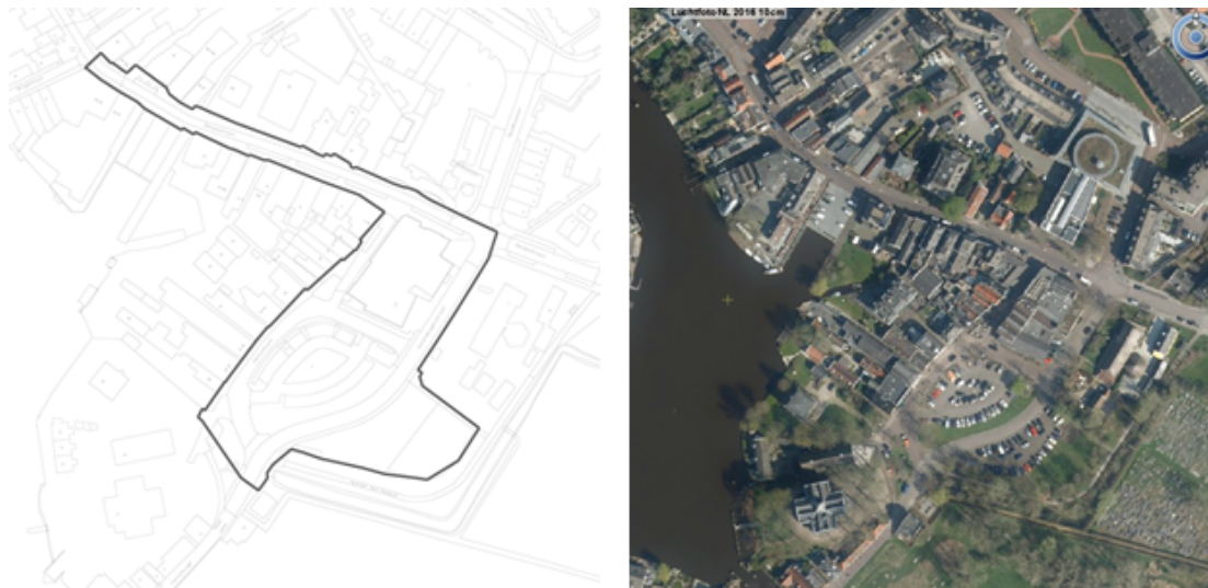
Figuur 3.1 't Kampje