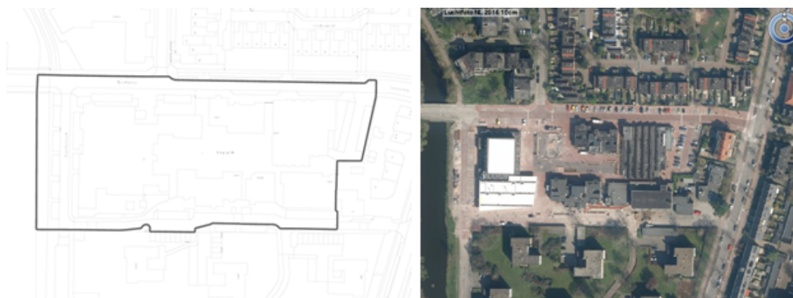
Figuur 3.9 Dorpsplein Duivendrecht

Er zijn maximaal 20 evenementen toegestaan, waarvan maximaal 8 evenementen van geluidscategorie 1. Evenementen van geluidscategorie 1 duren maximaal 2 dagen. De maximale geluidbelasting voor evenementen met geluidscategorie 2 wijkt af van reguliere norm en bedraagt 85 dB(A); bij evenementen met geluidscategorie 1 is een geluidbelasting hoger dan 100 dB(A) toegestaan. Op zondag t/m donderdag duren de evenementen maximaal tot 23:00 uur; op vrijdag en zaterdag tot 01:00 uur (daaropvolgende dag).