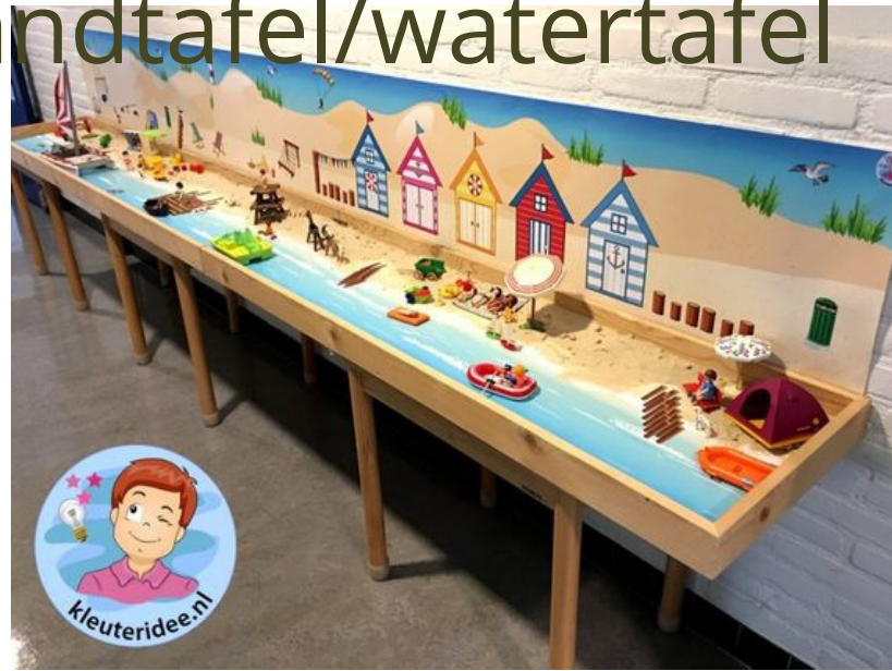
Eigen schuur voor kleuterbuitenspeelmateriaal Eigen deur naar buiten naar het speelplein (kleuters)