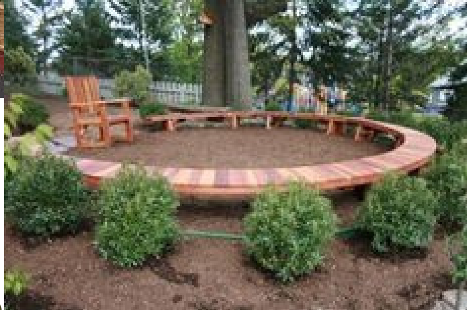
Plek voor kring buiten