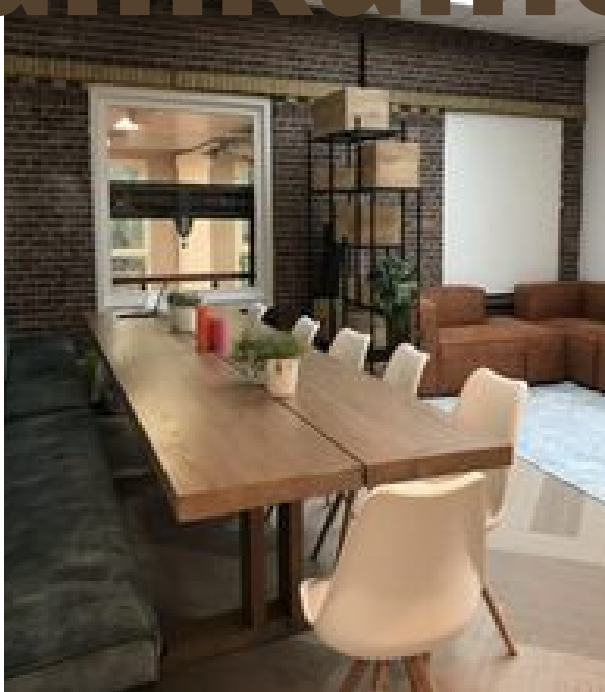
Tafel waar iedereen aan kan Werkplek voor vergaderingen