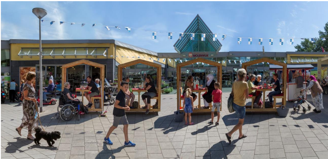
Praethuisjes project in het kader van de week tegen geweld .

aanvullend nodig is aan deskundigheidsbevordering en hoe dit efficiënt bereikt kan worden. Veilig Thuis heeft een belangrijke rol in het geven van voorlichtingen. Voor 2018 zijn ongeveer 200 bijeenkomsten gepland. Deze zullen vanwege toenemende vraag vanuit het veld nog meer dan voorheen vraaggericht worden ingezet. Ook verzorgt Veilig Thuis algemene preventie-activiteiten voor de hele regio. Daarnaast zijn er bijeenkomsten op de terreinen partnergeweld, kindermishandeling, eerge relateerd geweld, ouderenmishandeling, meisjesbesnijdenis en complexe scheidingen .