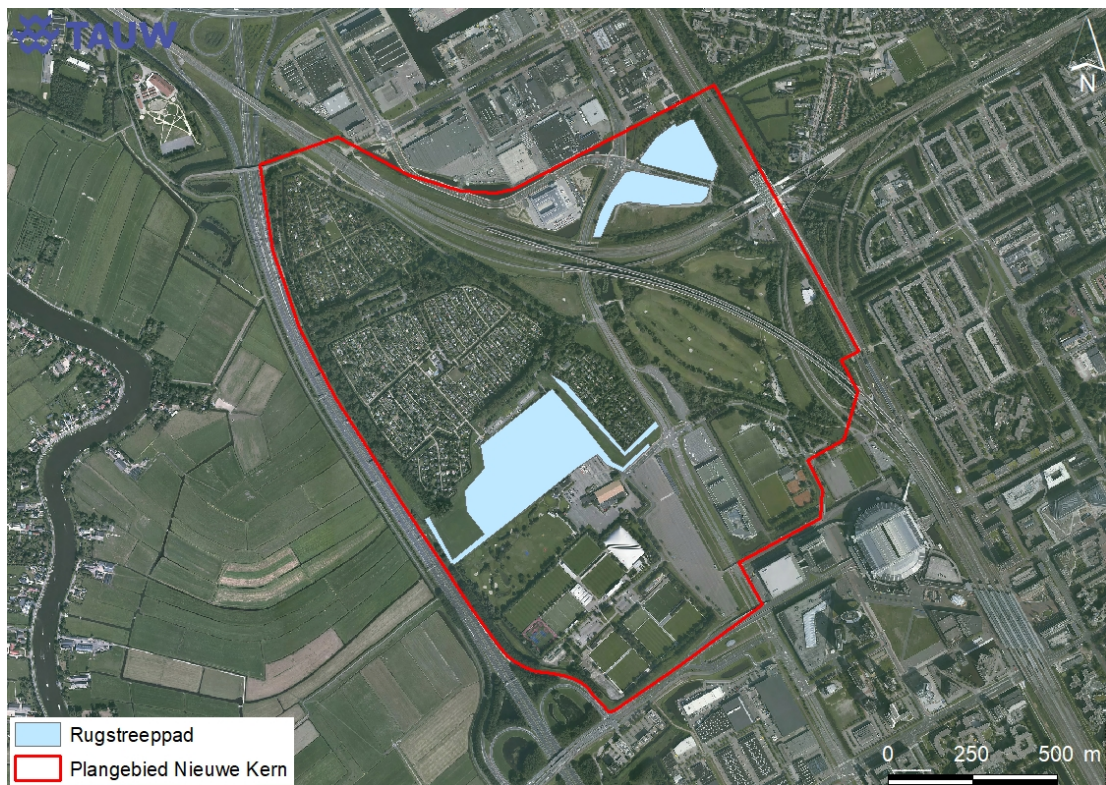
Figuur 3.6 Geschikt voortplantingshabitat voor rugstreepad binnen het plangebied

voor de ontwikkeling van het PostNL-distributiecentrum. Hoewel geen recente waarnemingen van de soort gedaan zijn, toont de vindplaats in 2016 het opportunistische pionierskarakter van de soort aan. Het is daarom niet op voorhand uit te sluiten dat de soort in het plangebied voorkomt. De soort wordt met name in nieuw en/of plantenarm ondiep water aangetroffen. Echter, waarnemingen in poldersloten worden ook wel gedaan. Hierom is het moeilijk om binnen het plangebied wateren als voortplantingshabitat uit te sluiten. Veel van de wateren worden periodiek opgeschoond, zijn recent gegraven of vergraven. Hierdoor wordt een mogelijke voortplantingsplaats voor de soort gecreëerd. Alleen wateren met beschoeiingen zijn niet geschikt als zodanig. De wateren rond de volkstuinten en golfbanen zijn bijvoorbeeld niet als voortplantingswater geschikt. Ze zijn ofwel beschoeid, ofwel te dicht begroeid, ofwel gelegen naast bosschages waardoor veel bladval in het water ontstaat. Met name de wateren op ruderaal terreinen in het plangebied en de poldersloten aan de zuidwestkant van het plangebied zijn als mogelijk voortplantingswater geschikt.