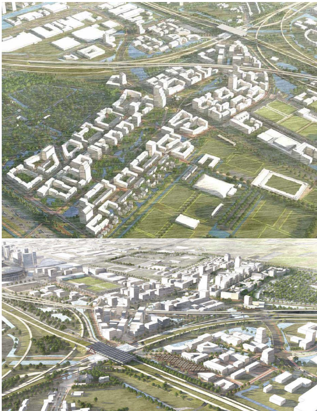
Figuur 2.3 Artistieke impressie van de nieuwe inrichting van het plangebied (bron: concept stedenbouwkundige visie De Nieuwe Kern, december 2019)