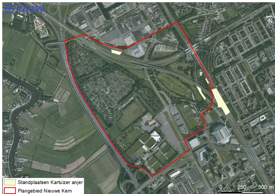
Figuur 3.1 Standplaatsen Kartuizer anjer in het plangebied (rood) ten opzichte van het te ontwikkelen gebied (geel)

Gelet op de plannen zoals deze in dit stadium ter inzage liggen, is niet te verwachten dat standplaatsen van Karthuizer anjer verdwijnen. De standplaatsen concentreren zich met name rond station Strandvliet. Hier worden in het kader van de Nieuwe Kern geen ontwikkelingen verwacht (zie figuur 3.1). Een negatief effect op de huidige standplaatsen van de Kartuizer anjer zijn daarom uit te sluiten.