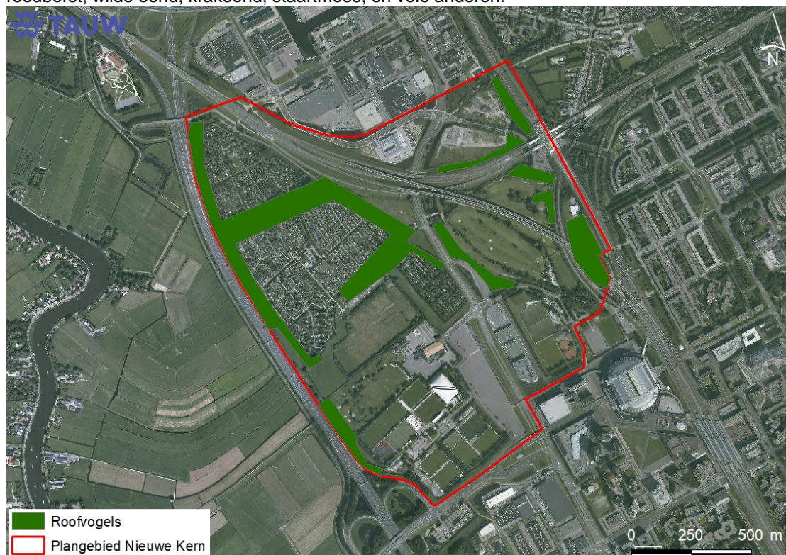
Figuur 3.5 Locaties waar onderzoek naar jaarrond beschermde roofvogelnesten noodzakelijk is

De nesten van deze soorten zijn beschermd als ze als broedlocatie in gebruik zijn. Bij het oriënterende veldbezoek is geconstateerd dat veel terreindelen van het plangebied, geschikt zijn als broedlocatie van deze vogelsoorten. Tijdens het veldbezoek is ook een breed scala aan algemene broedvogelsoorten waargenomen zoals meerkoet, waterhoen, zwarte kraai, houtduif, roodborst, wilde eend, krakeend, staartmees, en vele anderen.