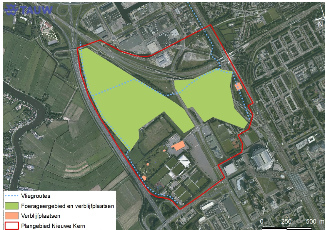
Figuur 3.4 Locaties waar in ieder geval onderzoek naar verblijfplaatsen, foerageergebied en vliegroutes van vleermuizen noodzakelijk is