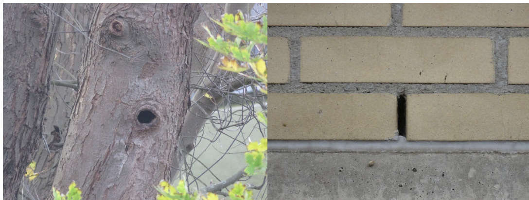
Figuur 3.3 Voorbeelden van geschikte verblijfplaatsen voor vleermuizen. Links een holteboom, rechts een open stootvoeg richting een spouwmuur

aanwezig. In de verschillende bomenlanen, bosschages en boomgroepen zijn holtes (zie figuur 3.3) aangetroffen die voor vleermuizen (mogelijk) geschikt zijn als verblijf. In gebouwen zijn ruimtes zoals spouwmuren, onder daken, achter gevelbetimmeringen en achter loodflapjes geschikt bevonden voor vleermuizen (zie figuur 3.4). Vanwege de kenmerken van de verschillende gebouwen die mogelijk verdwijnen, is een massawinterverblijf van de gewone dwergvleermuis uitgesloten. De gebouwen zijn niet bijzonder groot, of bevatten maar kleine delen die geschikt zijn als verblijfplaats. Paarverblijfplaatsen en winterverblijfplaatsen van de tweekleurige vleermuis zijn eveneens uit te sluiten. Er is in het plangebied geen hoogbouw aanwezig terwijl de tweekleurige vleermuis voor zijn paar- en winterverblijfplaatsen hoogbouw verkiest. Ook winterverblijfplaatsen van gewone grootoorvleermuis en watervleermuis zijn in het plangebied uit te sluiten. Deze soorten verblijven in de winter vrijwel uitsluitend in (ondergrondse) bunkers of grotssystemen. In tabel 3.3 is weergegeven welke soorten en functies er in het plangebied verwacht worden. Op deze tabel dient ook het nader onderzoek naar vleermuizen gebaseerd te worden.