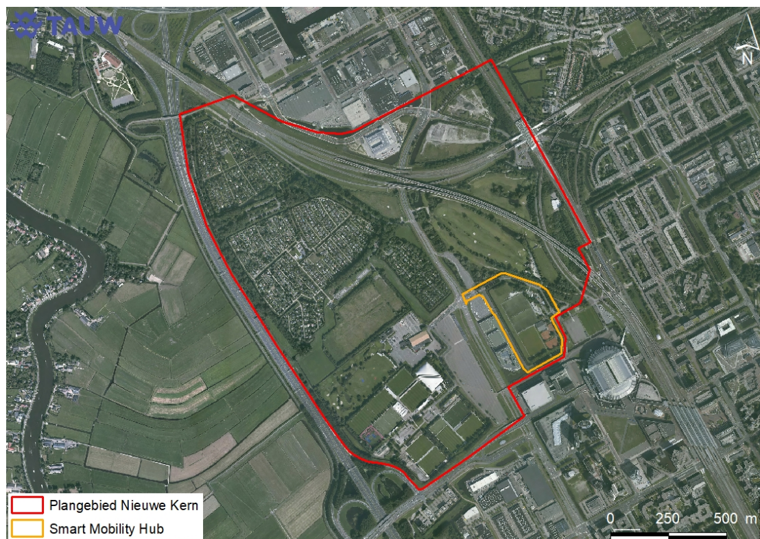
Figuur 2.1 Ligging van het plangebied (rood) en het plangebied voor de Smart Mobility Hub (oranje) Laatstgenoemde plangebied is in deze toetsing niet meegenomen. (GIS-kaart)

Het plangebied 'De Nieuwe Kern' ligt tussen Amstel Business Park, het station Duivendrecht, de Johan Cruijff Arena en de A2 en vormt daarmee een onderdeel van de Amstelcorridor (van het Amstel Station tot het Amsterdam UMC). Figuur 2.1 toont de ligging van het plangebied. Bijlage 1 geeft een sfeerimpressie van het gebied. Het plangebied bestaat uit volkstuinen, golfbanen, een slib- en gronddepot, enkele bedrijfspanden, bosschages, infrastructuur, wegbermen en enkele braakliggende terreinen. Rond het plangebied zijn woonwijken, industrie, de Amsterdam Arena, sportcomplexen en een grote polder gelegen. De polder bevindt zich aan de westzijde van het plangebied. De Arena en sportcomplexen aan de zuidkant en de woonwijken en industrieterreinen aan oost- en noordkant. Deels binnen het plangebied van De Nieuwe Kern ligt een andere ontwikkeling, namelijk: Smart Mobility Hub (SMH). Dit betreft een autonome ontwikkeling en is geen onderdeel van het onderzochte plangebied voor deze toetsing. Bij het veldbezoek is het terrein binnen de begrenzings van SMH niet meegenomen.